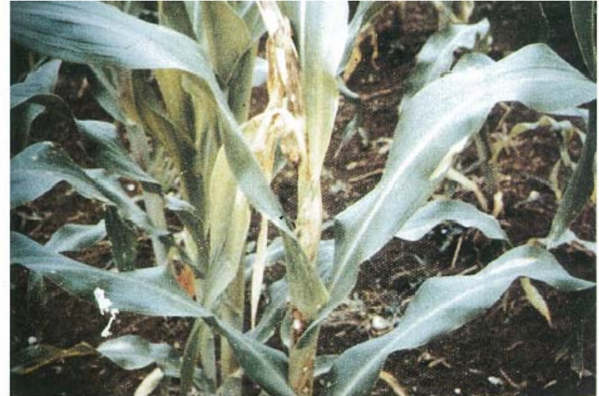
Pourriture des gaines du maïs