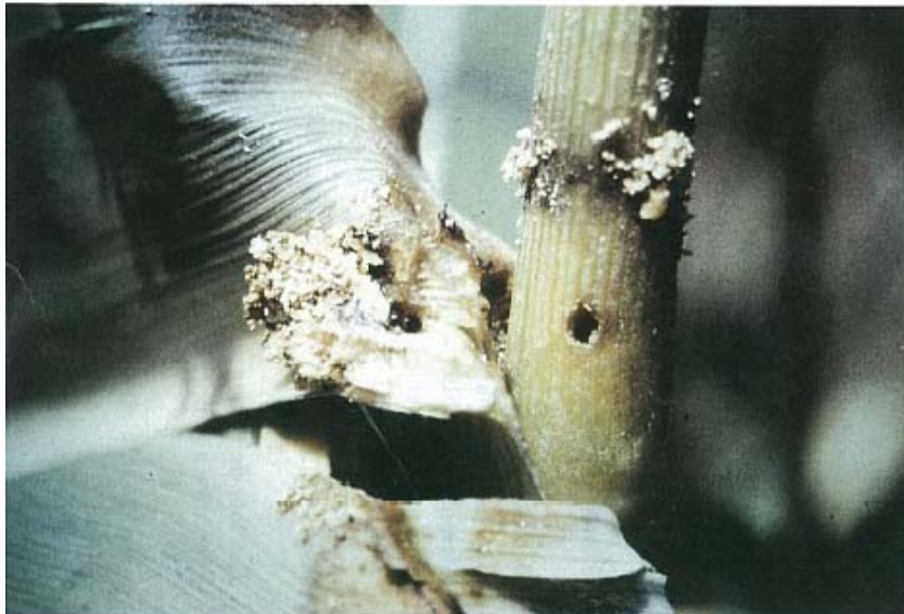
Tige de maïs trouée par une chenille foreuse