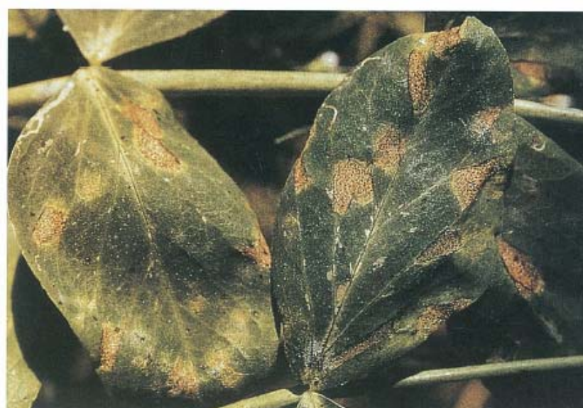
Septoriose du petit pois