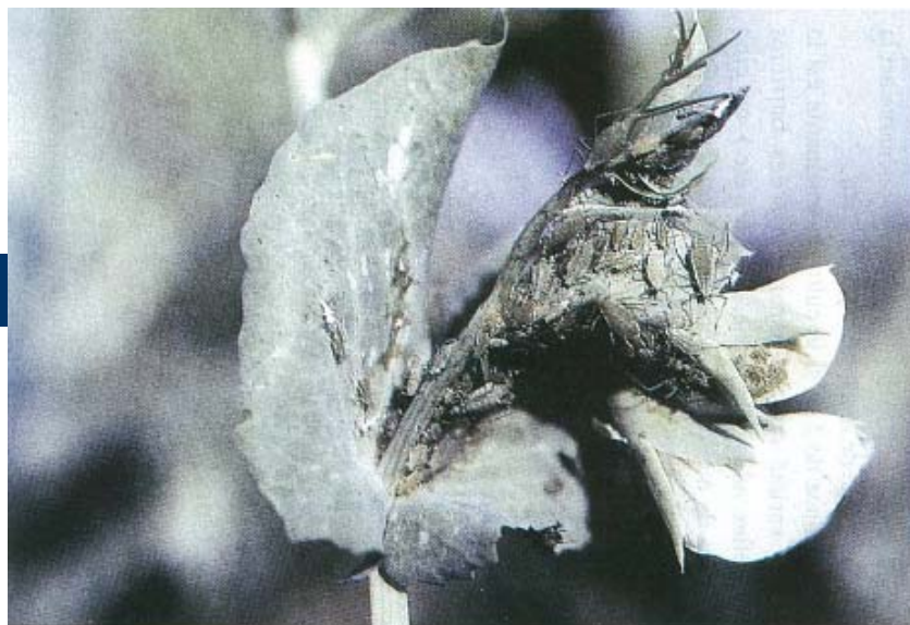
Puceron vert du petit pois colonisant un bouton floral