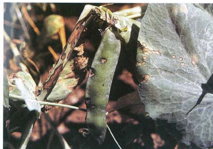
Anthraxnose sur tige, gousse, et feuille du petit pois