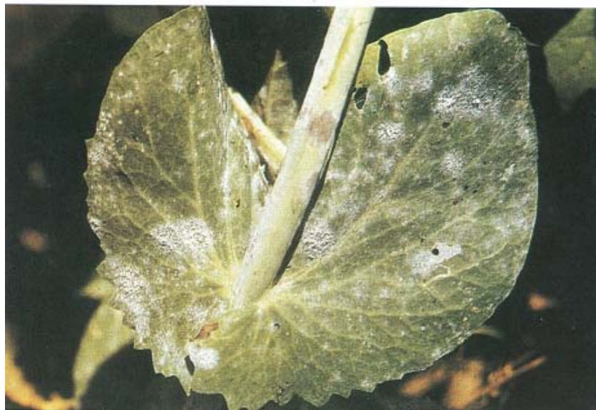
Oïdium ou blanc du petit pois